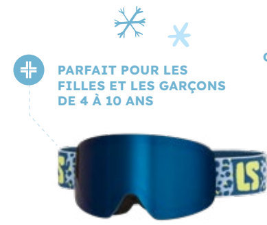
1. Masque de ski Junior