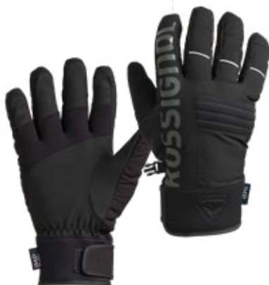
6. Gants de ski Homme