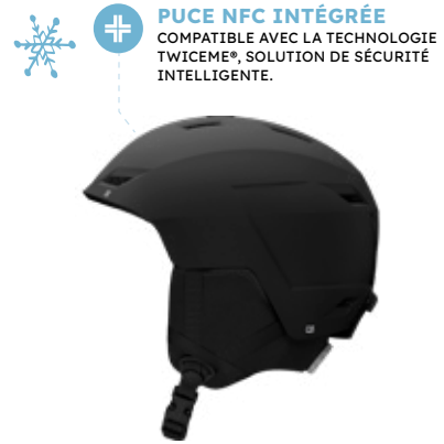
3. Casque de ski Junior