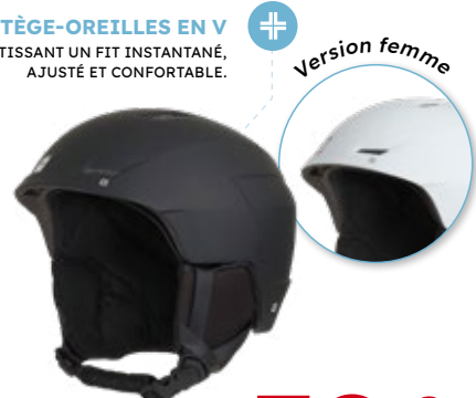
6. Casque de ski Adulte