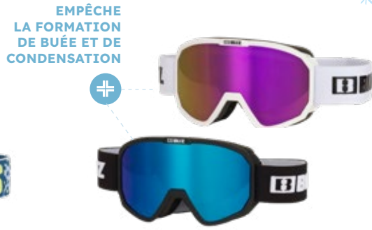
2. Masque de ski Junior