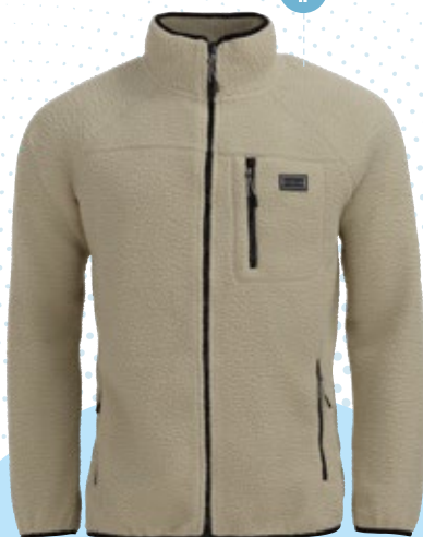
10. Polaire Homme