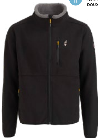
7. Polaire Homme