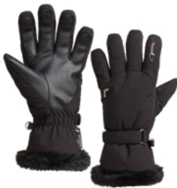
11. Gants de ski Femme