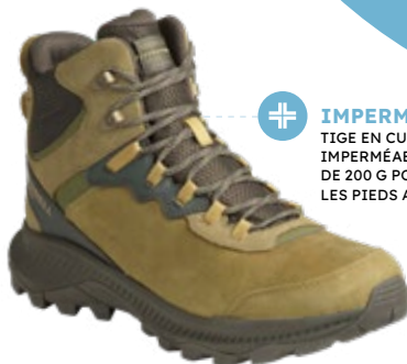
8. Après-skis Speed Strike 2 Thermo Cuir Waterproof Mid Homme

IMPERMÉABLES TIGE EN CUIR, MEMBRANE IMPERMÉABLE ET ISOLATION DE 200 G POUR CONSERVER LES PIEDS AU CHAUD.