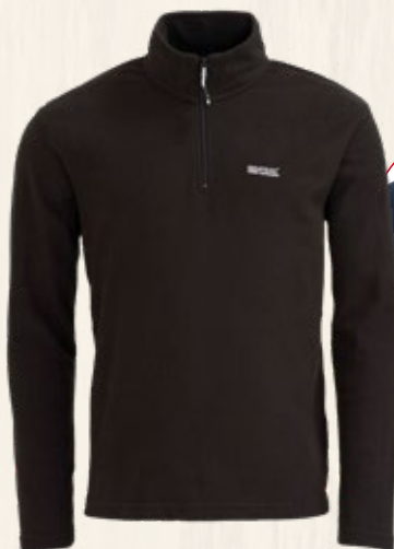
2. Polaire semi-zippée Homme