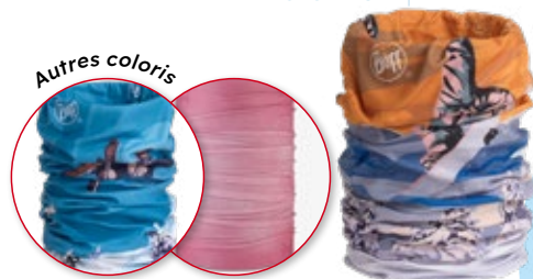
8. Buff Ecostretch original Adulte

FABRIQUÉ À PARTIR DE BOUTEILLES EN PLASTIQUE RECYCLÉES