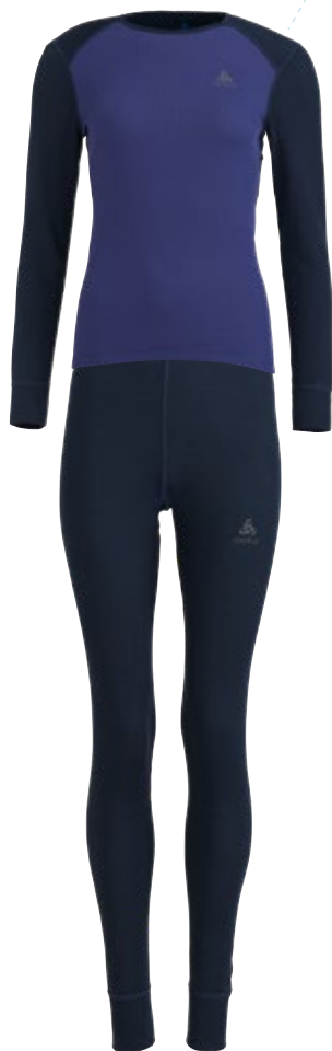
7. Ensemble première couche Femme

CHAUD PRÉSERVE VOTRE CHALEUR ET ÉVACUE RAPIDEMENT L'HUMIDITÉ.