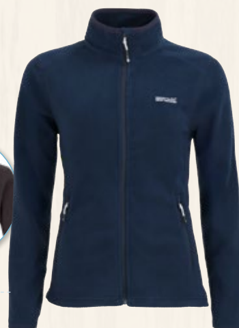
10. Polaire Femme