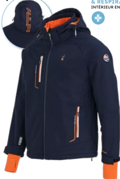
9. Veste Softshell Homme