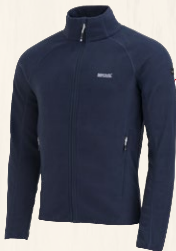
1. Polaire Homme