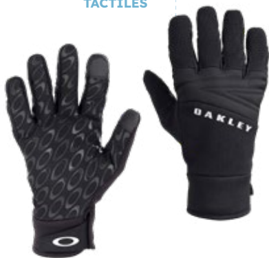
5. Gants de ski Homme