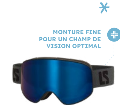
4. Masque de ski Adulte