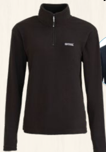
9. Polaire semi-zippée Femme