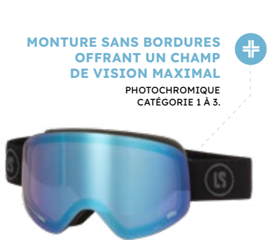
5. Masque de ski Adulte